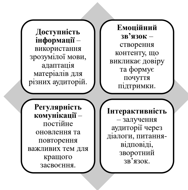
Рисунок 1.2. Основні підходи до подолання комунікаційних бар'єрів