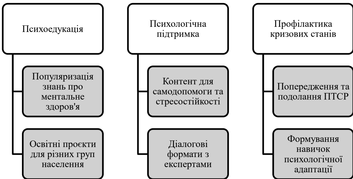
Рисунок 1.1. Основні напрями використання подкастів у сфері ментального здоров'я

В умовах воєнного стану подкасти можуть відігравати роль інформаційного посередника між фахівцями та широкою аудиторією, що сприяє поширенню доказової інформації про способи подолання стресу, адаптаційні механізми та методи психологічної допомоги. Основні напрями використання подкастів при цьому описано на рисунку 1.1.