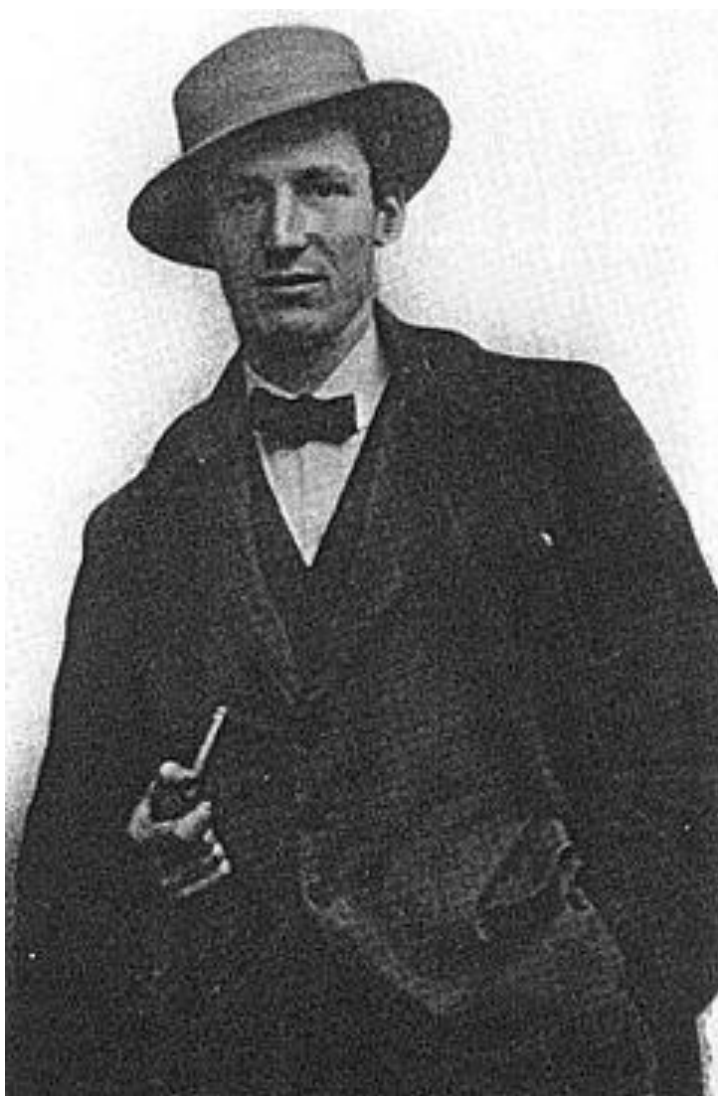
портрет Антоніо Сант-Еліа Додаток№