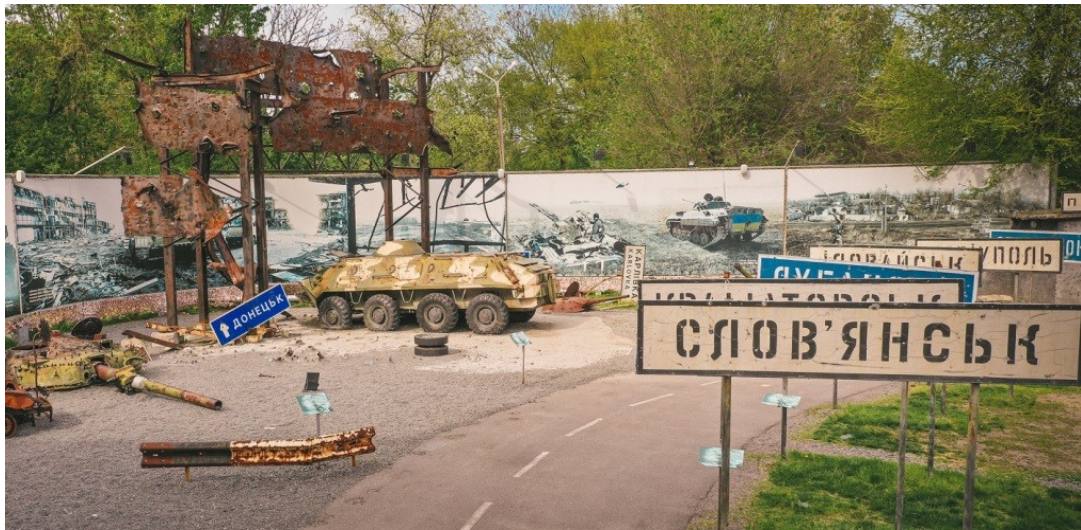
Рис.1 Музей АТО.

Таким чином, для розбудови воєнного туризму в Україні важливо не лише зберегти та дослідити наявні меморіали й музеї, а й об'єднати державну підтримку, наукове опрацювання та залучення місцевих громад в однорідну мережу об'єктів, яка відобразить багатосторонню історичну пам'ять від давнини до сьогодення.