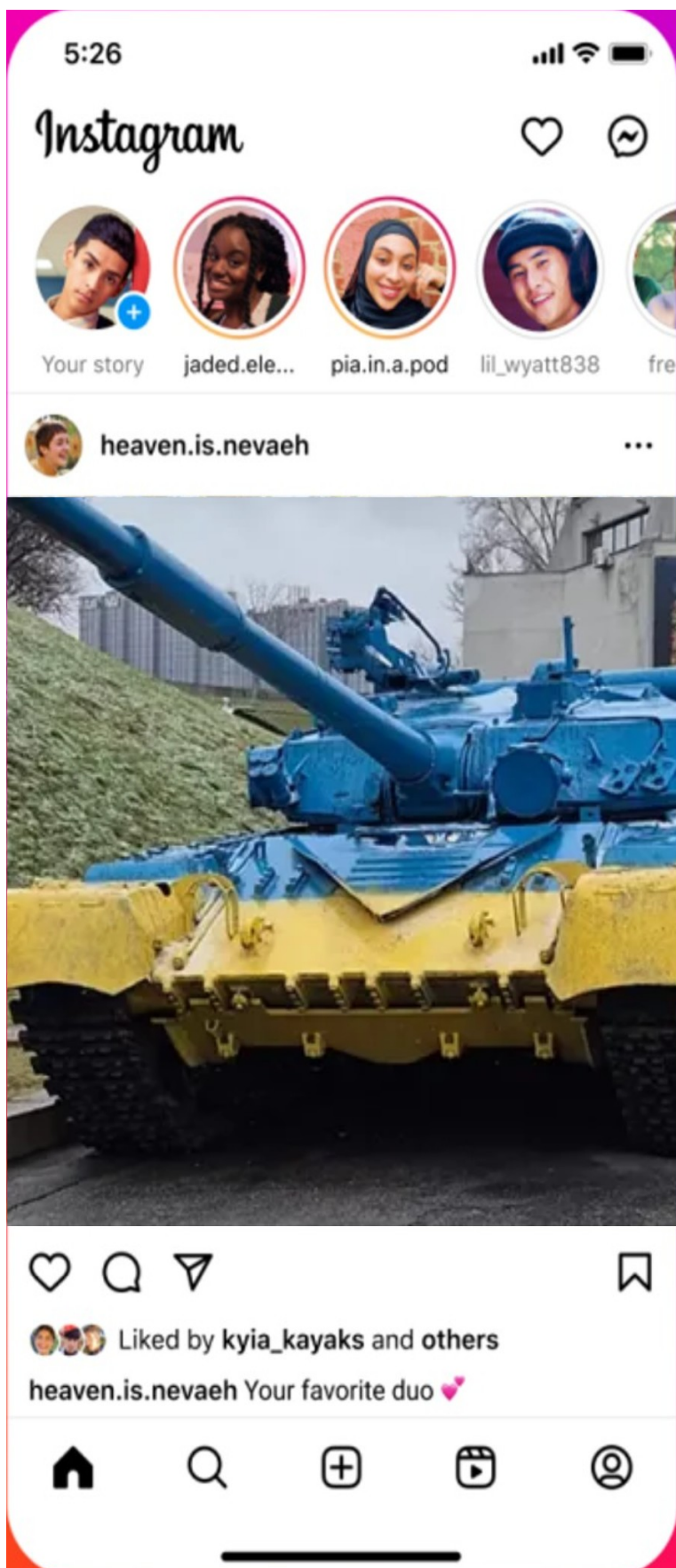
Приклад 1. Публікації у соціальних мережах