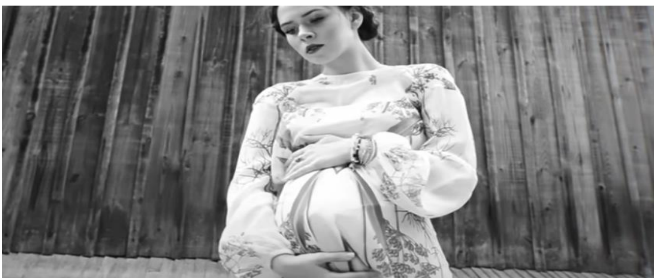
Рис. 1.15. Образ Ю. Саніної у відеокліпі «Helpless» (2016)