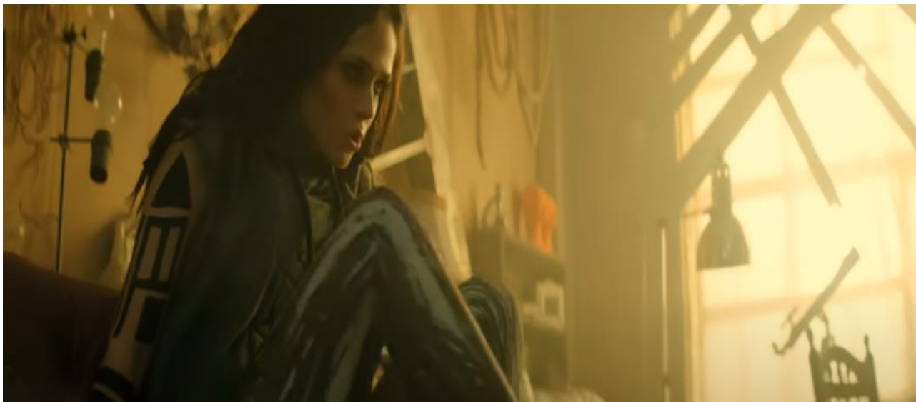
Рис. 1.7. Кадр з відеокліпу «Organ»