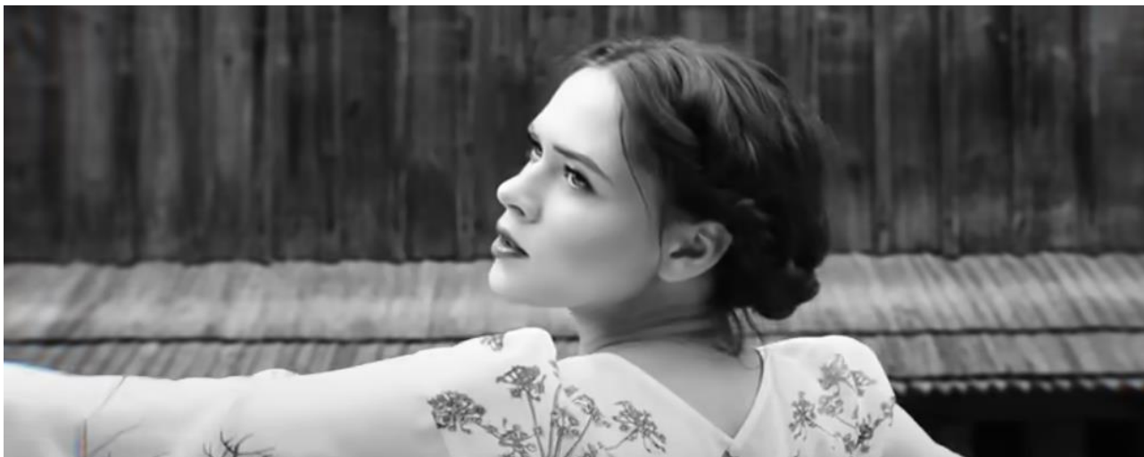
Рис. 1.14. Образ Ю. Саніної у відеокліпі «Helpless» (2016)