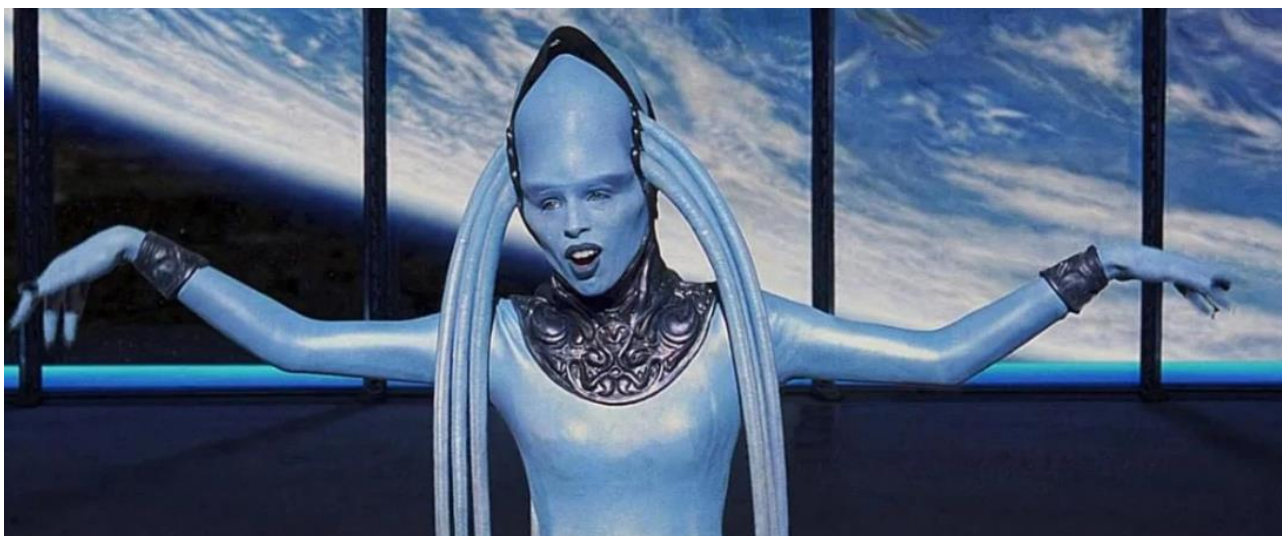
Рис. 1.21. Інопланетна співачка з кінофільму «5 елемент»