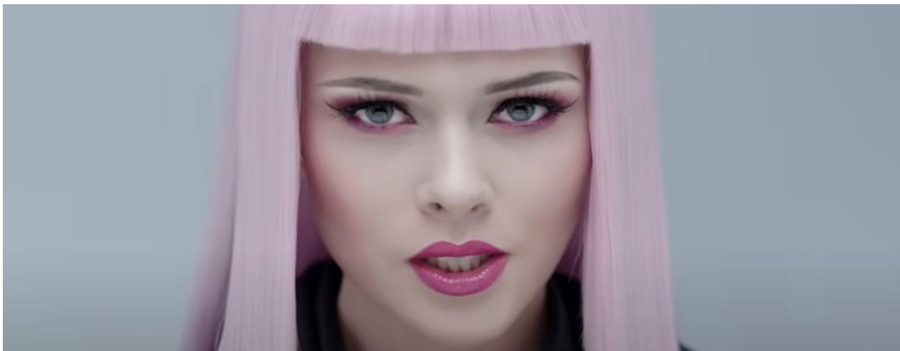
Рис. 1.3. Кадр з відеокліпу «Strange Moves» (2014)