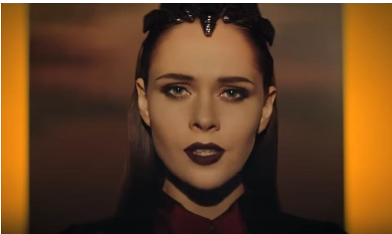
Рис. 1.20. Образ Ю. Саніної у відеокліпі «Мелодія» (2018)