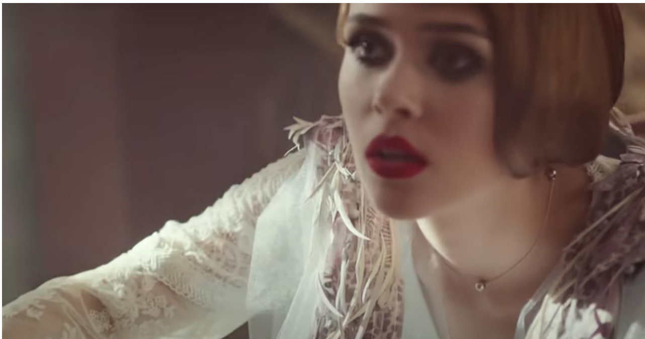
Рис. 1.17. Образ Ю. Саніної у відеокліпі «Rain» (2016)