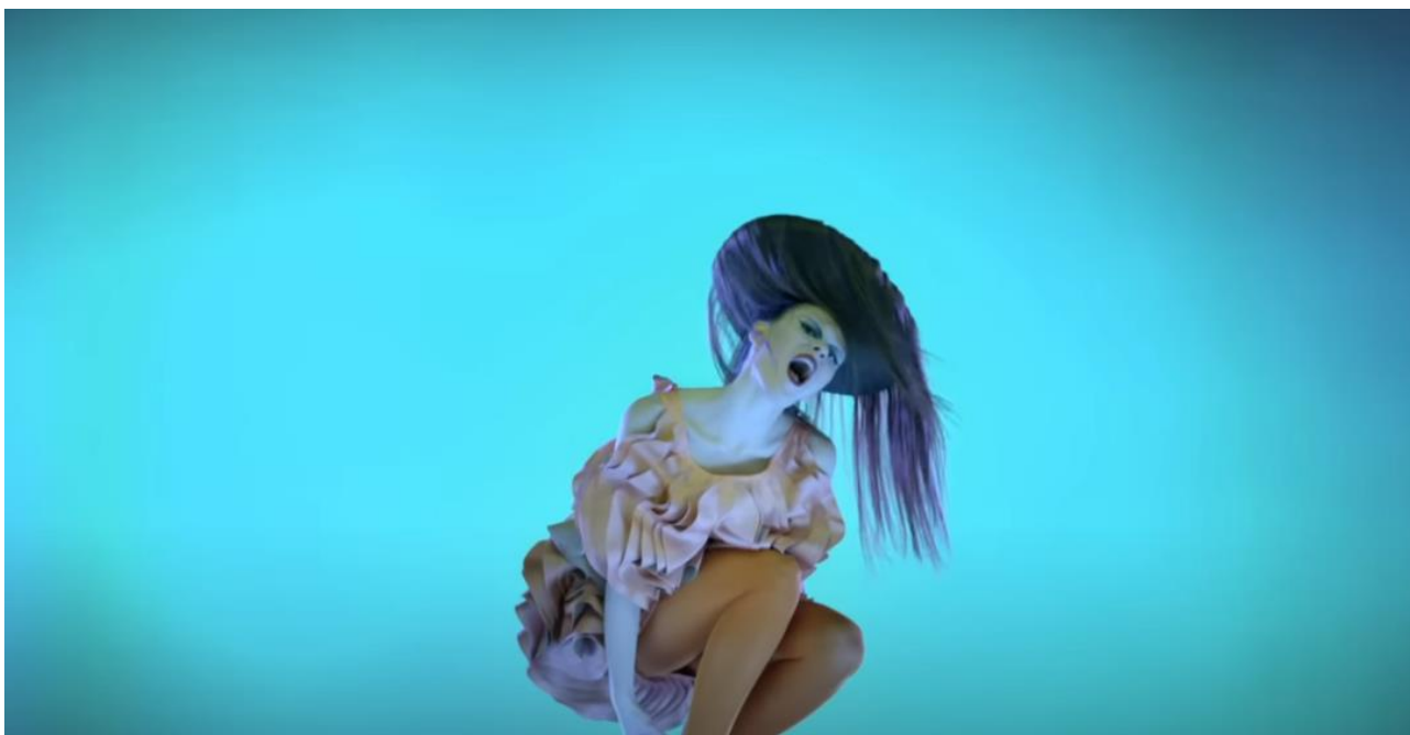
Рис. 1.1. Кадр з відеокліпу «Dance with Me» (2011)