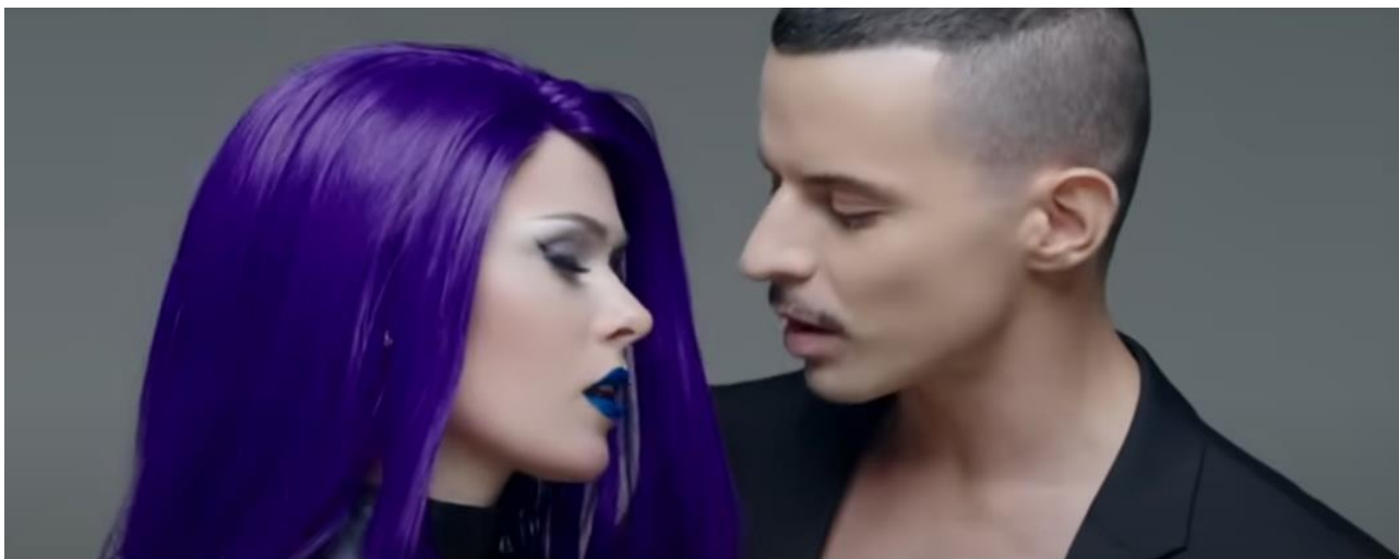
Рис. 1.4. Кадр з відеокліпу «Strange Moves» (2014)