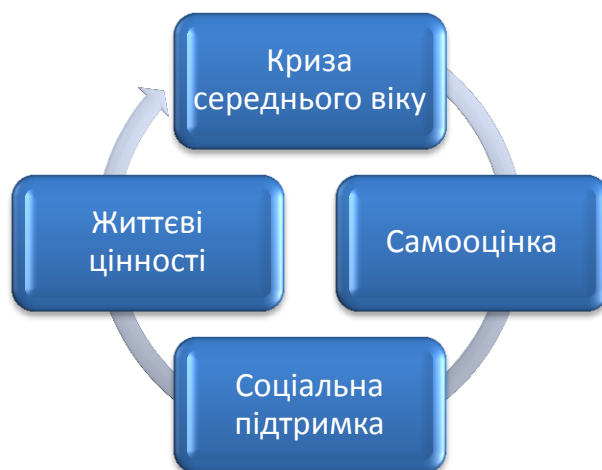
Рис.2.2 Концептуальна модель особистісних чинників подолання кризи середнього віку

Криза середнього віку – центральний компонент, що позначає період переосмислення особистістю свого життя, досягнень та життєвих цілей. Криза часто супроводжується емоційними труднощами, сумнівами щодо власної реалізації, а також прагненням до змін. У цей час особа звертається до внутрішніх ресурсів та шукає підтримку в оточенні, щоб пройти через цей складний етап.