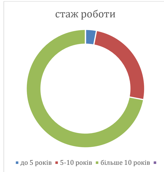
Рис 2.3 Стаж роботи