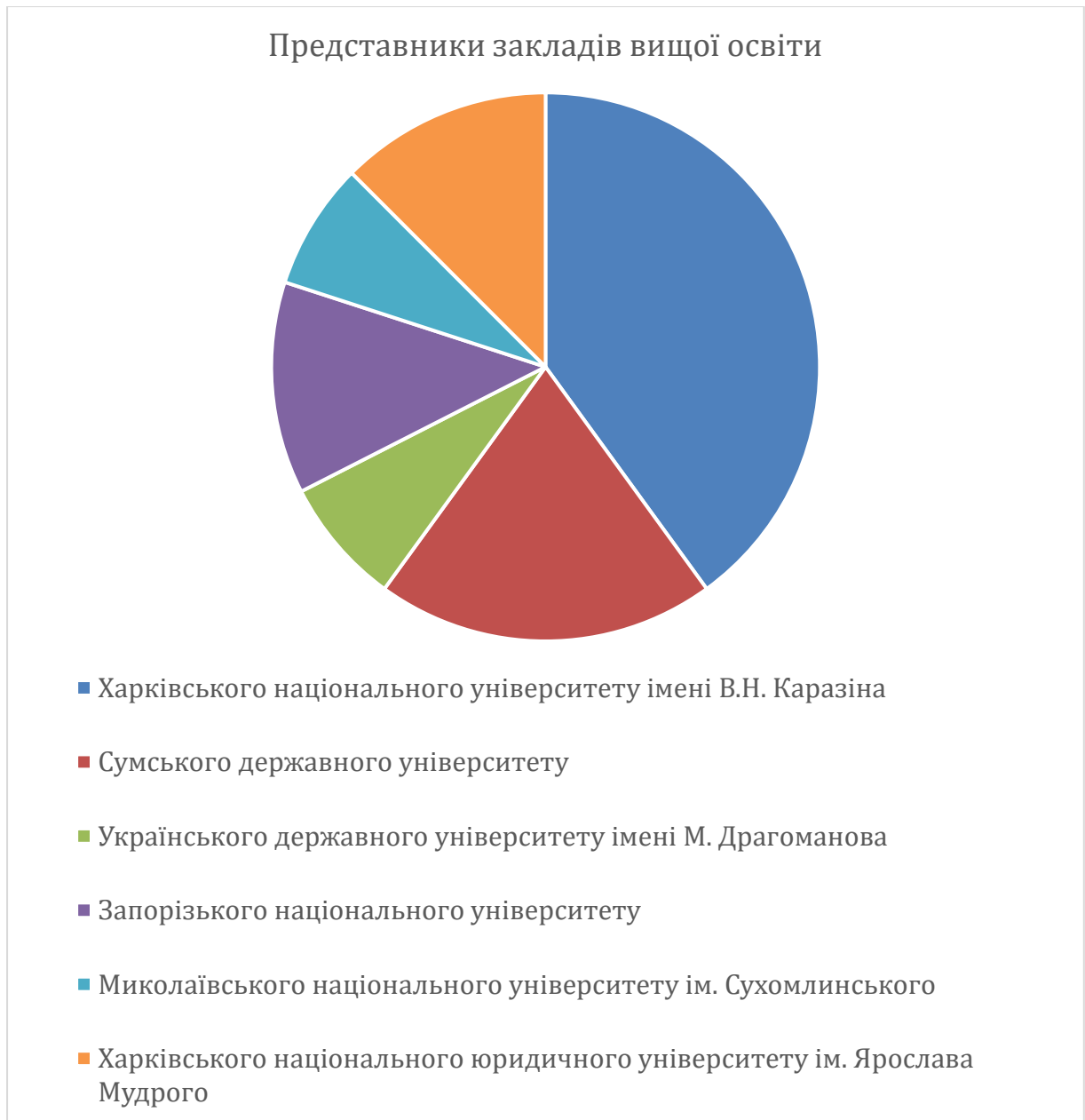
Рис 2.1 – Представники закладів вищої освіти

Вік і професійний досвід можуть мати вплив на розвиток емоційного вигорання (дивись Рис 2.2 та Рис 2.3). Молодші працівники часто переживають стрес через незадоволеність своєю кар'єрою або через високі вимоги, що ставляться до їхньої роботи. Водночас, досвідченіші педагоги можуть відчувати виснаження як фізичне, так і емоційне, через довготривалу професійну діяльність та накопичену втому. Це різниця в сприйнятті роботи між різними віковими групами може поглиблювати або