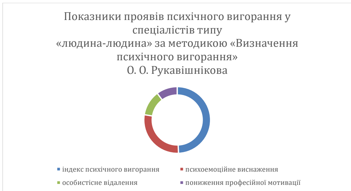
Рис 2.4 Показники проявів психічного вигорання у спеціалістів типу «людина-людина»

Пропонуються результати дослідження проявів синдрому вигорання серед педагогічних фахівців, чия діяльність передбачає інтенсивну взаємодію з людьми, під час військових дій (дивись Рис 2.4).