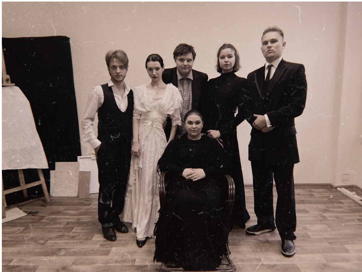
Фото з дипломної вистави «Чорна Пантера і Білий Медвідь» 1 дія