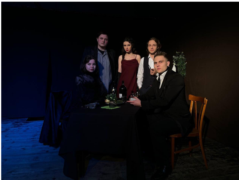
Фото з дипломної вистави «Чорна Пантера і Білий Медвідь» 2 дія