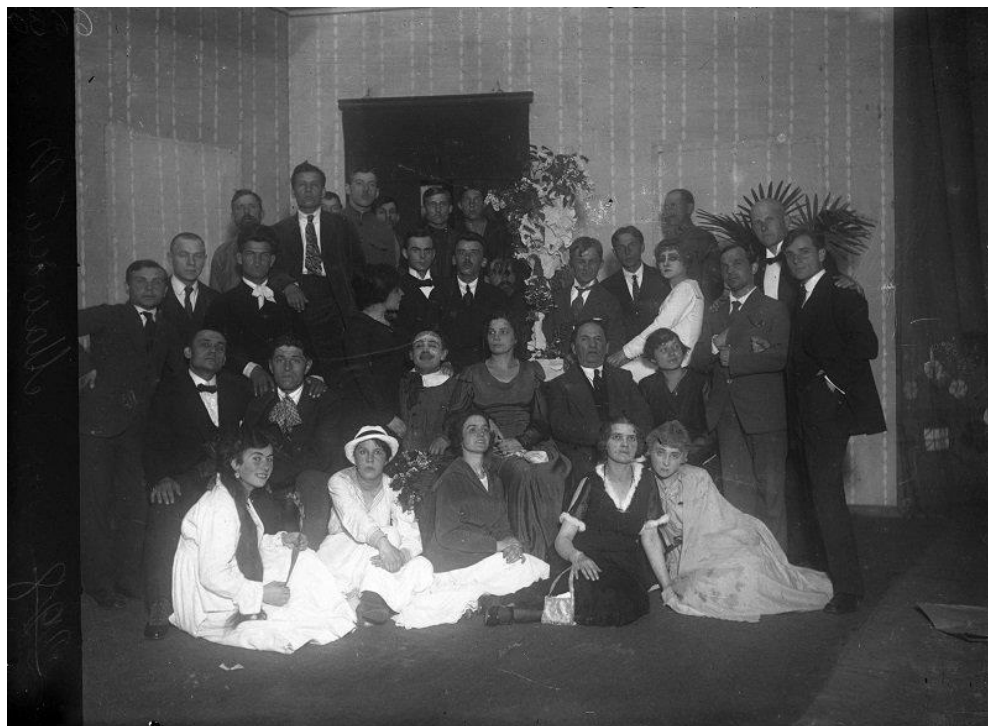
Фото після прем'єри.

Вистава «Чорна Пантера і Білий Ведмідь». «Молодий театр» Лесь Курбас.