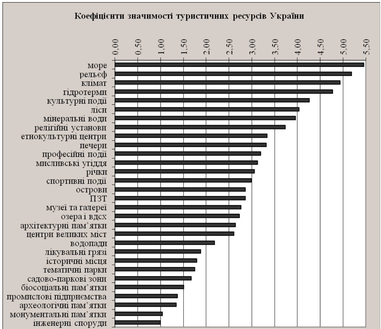
Рис. 1. Значимість основних туристичних ресурсів України [48, с. 57-65]