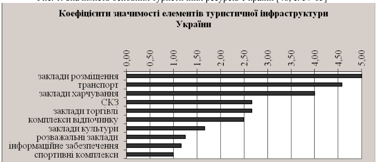
Рис. 2. Значимість елементів туристичної інфраструктури України [48, с. 57-65]