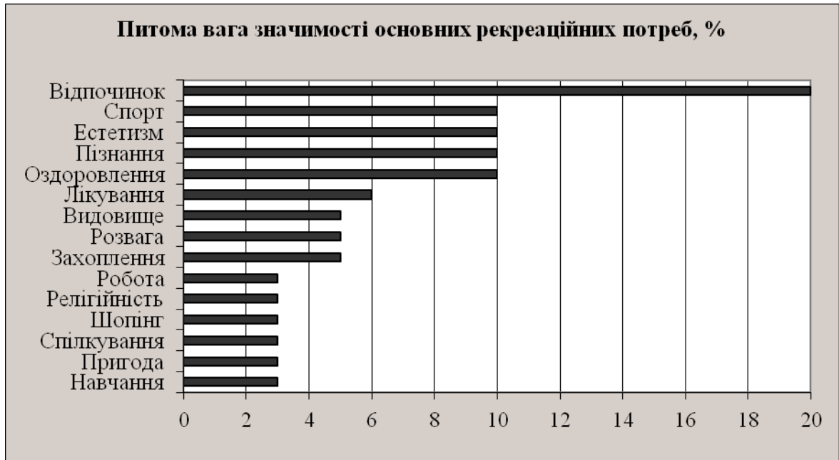
Рис. 1. Значимість основних рекреаційних потреб [48, с. 57-65]