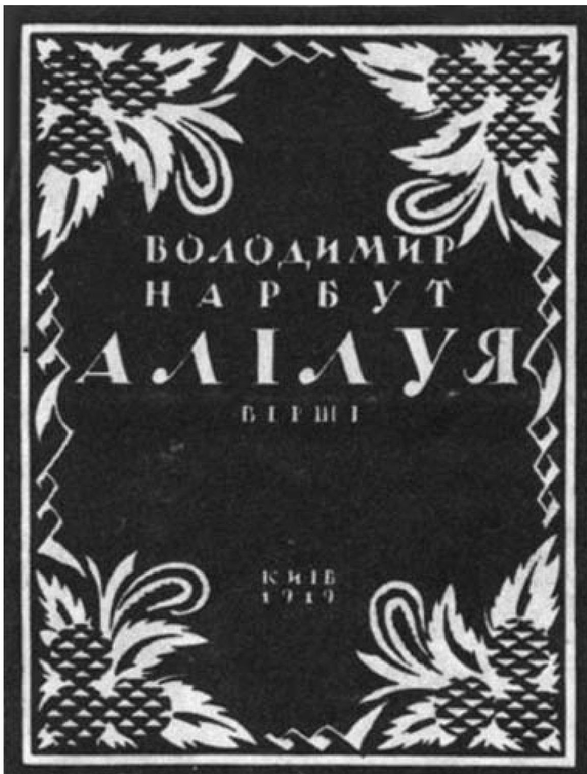
Г. Нарбут. Обкладинка книги В. Нарбута «Алілуя» (1919 р.)