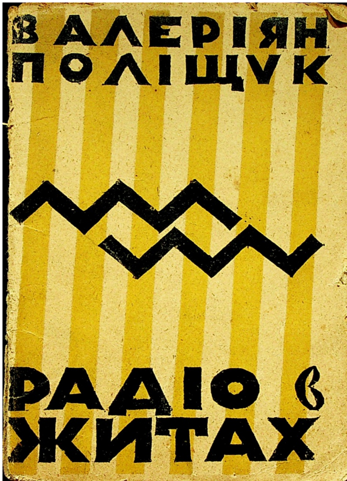
В. Єрмилов. Обкладинка до книги В. Поліщука «Радіо в житах» (1923 р.)