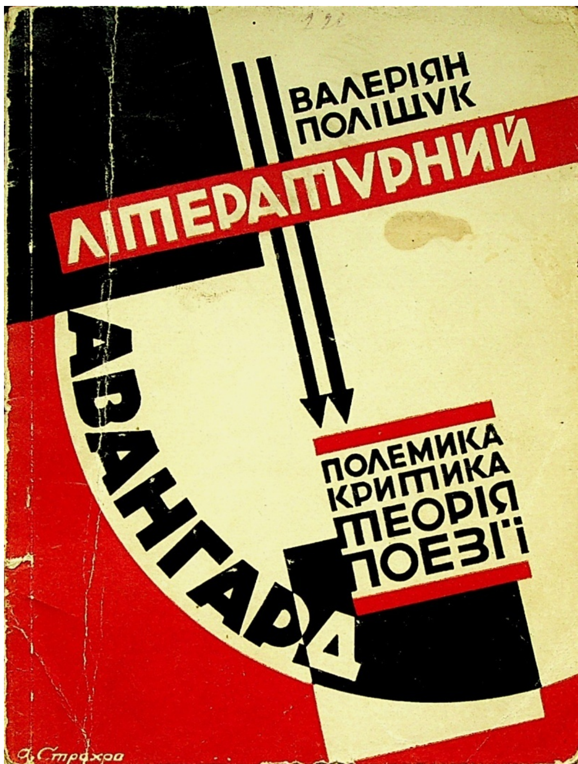
А. Страхів. Обкладинка до збірки В. Поліщука «Літературний авангард. Полемика. Критика. Теорія. Поезія» (1928 р.)