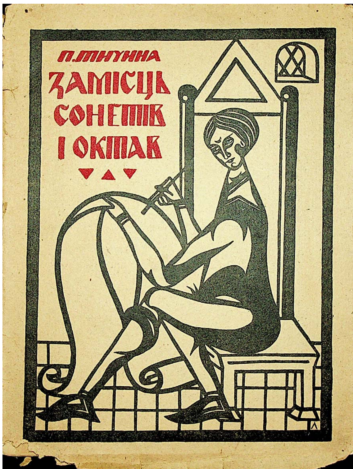
Л. Лозовський. Обкладинка книги П. Тичини «Замість сонетів і октав» (1920 р.)