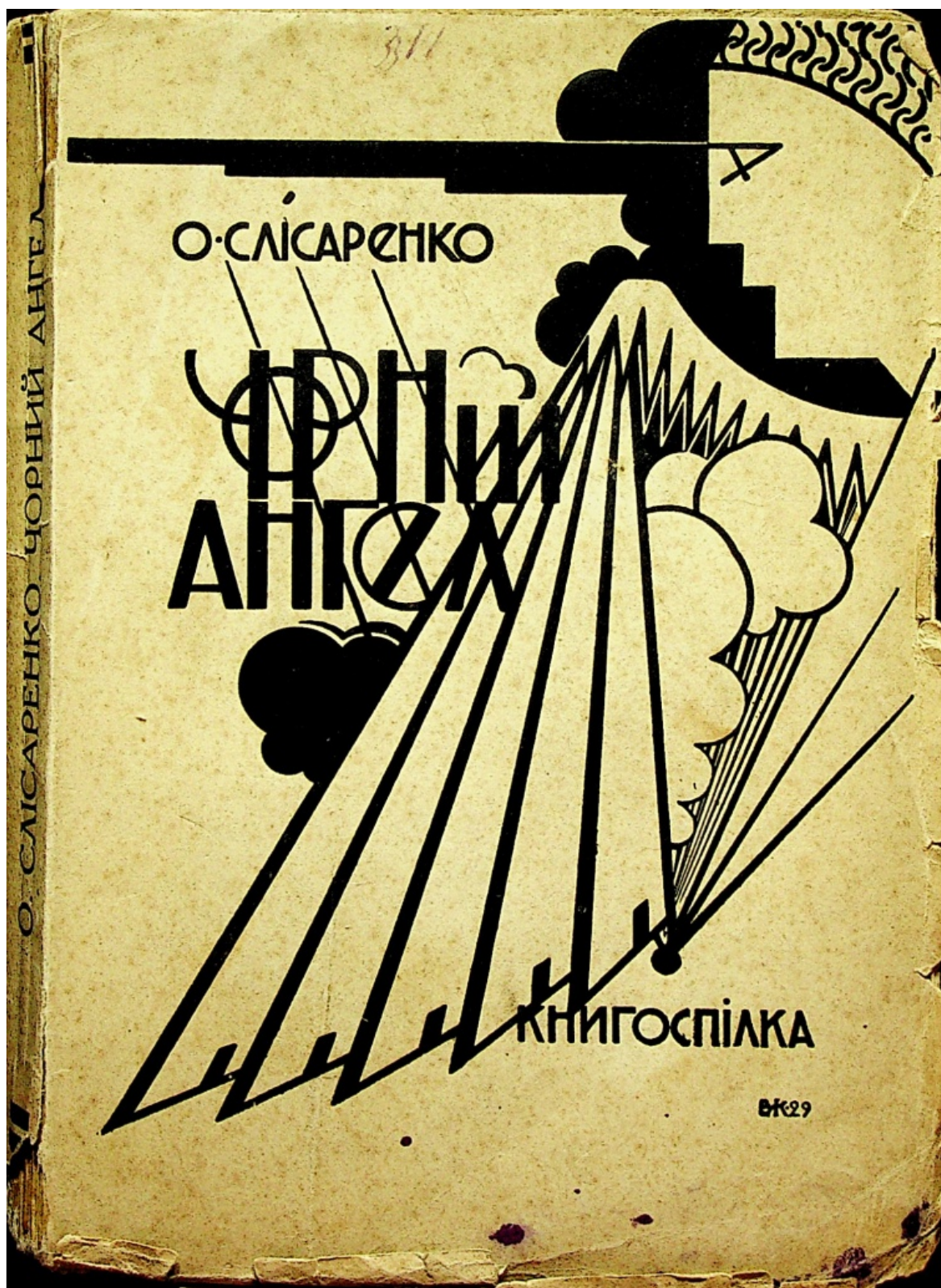
В. Кричевський. Обкладинка до книги О. Слісаренко «Чорний ангел» (1929 р.)