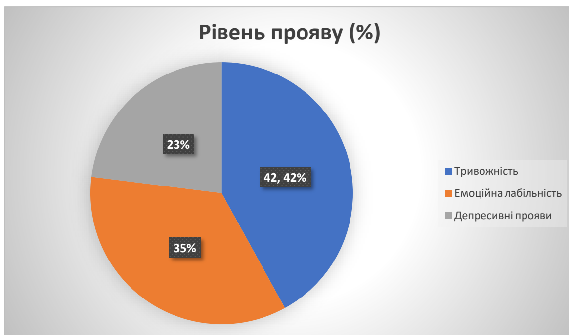
Рис. 2.1 - Розподіл емоційних реакцій при переживанні нормативних криз (N=48)

Аналіз емоційних реакцій показав переважання тривожності (42%) та емоційної лабільності (35%) у досліджуваних. При цьому рівень депресивних проявів виявився відносно низьким (23%), що може свідчити про адаптивний характер переживання нормативних криз.